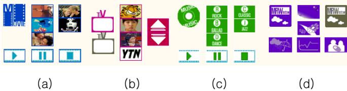
그림 4 서비스 제어 화면 (a) DVD 서비스 (b) TV 서비스 (c) 음악 서비스 (d) 디스플레이 서비스

로 제공되었다. 그에 비해 HSC는 전체적인 홈 환경을 보여주는 화면을 인터페이스와 결합시켜, 가전기기의 위치정보와 제어를 한 화면을 통해 보여준다. 사용자는 화면을 정지하여 볼 수 있고, 각각의 가전기기를 선택하여 나오는 그림 4와 같은 제어 화면을 통해 제어할 수 있다. 또한 서비스 일괄 수행을 지정할 수 있도록 서비스 선택 및 저장 화면을 제공한다. 이 기능으로 사용자는 자주 사용하는 서비스를 일괄적으로 등록하고 필요시마다 수행할 수 있도록 하였다.