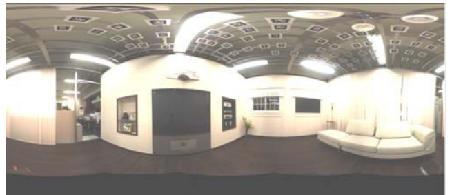
그림 3 GUI에 사용된 배경화면

사용자 인터페이스는 홈 환경과 발견 서비스 정보를 보여주는 배경화면, 각 서비스를 선택하면 나타나는 서비스 제어 화면, 그리고 여러 서비스를 일괄 등록할 수 있는 일괄 수행 설정 화면으로 구성된다.