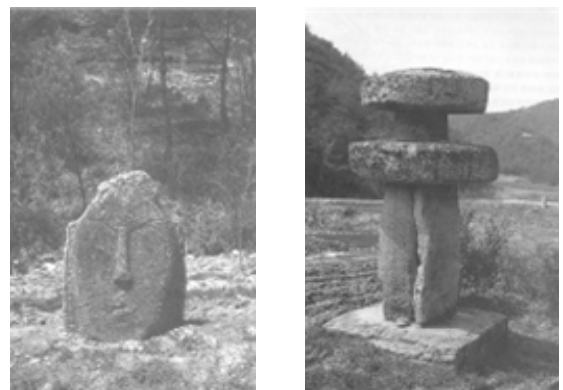
그림 2. 꿈꾸는 미소와 실패탑

땅속에서 꿈꾸는듯 미소짓는 불상., 실을 감아두는 실패처럼 생겼다고해서 실패탑, 물동이를 겹쳐 놓은듯 보이는 향아리탑, 옥개석과 탑신이 모두 원반형인 호떡탑 그중 어느것 하나 같은 것이 없다. 여기에 무정형의 아름다움이 있는 것이다.