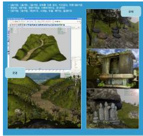
그림 6. 제작된 가상공간 3D

예술기획과 3D제작팀 기술팀 크게 세분야로 나누어 역할분담하였다. 기술팀은 시각/상호작용, 기하, 촉각, 청각, 표현, 전송, 웹으로 7개 분야가 결합하여 총인원 20여명이 함께 했다. 3D제작은 지형모델과 불상불탑 등 3D모델, 3D애니메이션을 제작했다. 작업인원은 2명이였다. 좌표값이 입력된 국토지리정보원의 실측지도를 구입하여 마야에서 사용하기위한 전처리 과정으로서 point sampling, mesh modeling, smoothing 과정을 거쳤다. 이후 마야에서 세부 지형 모델 생성작업을 거쳤고 나무, 풀등의 지형물 생성 및 texture mapping을 하였다.