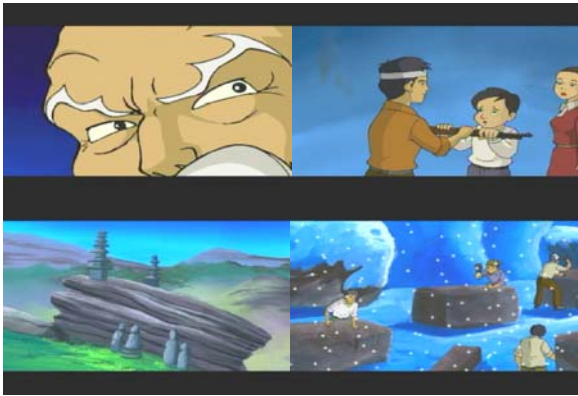
그림5. 가상공간 중심스토리텔링 (2D 애니메이션)

그로부터 천년이 지난 1980년 5월 남도의 민중은 독재에 항거해 고립되어 싸우다 미완의 새벽을 맞는다. 이 장렬한 죽음은 천년동안의 혼들을 불러모아 천불천탑을 다시 세울 힘을 갖게 하였다. 이리하여 또다시 천불산엔 망치소리가 울리기 시작한다. 사람들은 자신의 불상을 만들기 시작한다. 불상과 불탑은 가상공간에 놓여지고 천개의 불상과 천개의 불탑이 세워지면 와불이 일어나는 이벤트가 생긴다.