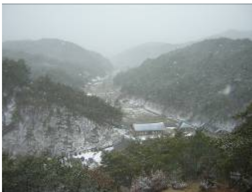
그림1. 운주사 전경

그러나 오늘날 운주사는 존재하나 부재하다. 무분별한 개발과 복원의 과정에서 운주사가 가진 본래의 의미와 분위기가 많아 훼손되었다. 가상현실공간에서 본래의 아우라 (역사적 장소성)를 느낄수 있는 정신원형의 표현을 위해 1910년대 조선고적도보부터 80년대까지의 이미지와 텍스트들을 근거로 복원과 더불어 미륵신앙의 예술적 승화작업을 하고자 한다[2].