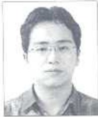
이 엄 호