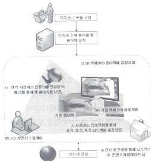
그림 1. 디지로그 북의 작동 과정

디지로그 북의 작동 과정. 그림 1은 디지로그 북의 작동과정의 예를 개념적으로 설명하고 있다. 사용자는 디지로그 북을 서점에서 구매한 후, 디지로그 북 뷰어를 컴퓨터에 설치한다. 뷰어가 실행되는 동안, 1) 컴퓨터에 연결된 카메라의 입력 영상으로부터 컴퓨터는 책의 페이지를 인식 및 추적한다. 그러면 2) 컴퓨터에 저장된 3D 모델, 비디오, 사운드, 그리고 또 다른 멀티미디어 콘텐츠들이 책 위에 증강된다. 만약 책이 이동되더라도 여전히 증강된 콘텐츠들은 책 위에 렌더링 된다. 3) 사용자는 책 위에 증강된 가상 콘텐츠들과