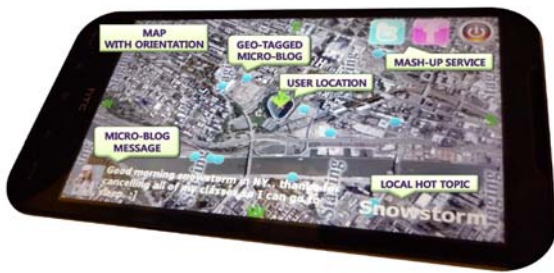
그림 1. 컨텍스트 인지 마이크로 블로그 브라우저

우리는 모바일 폰으로부터 컨텍스트를 얻고, 얻은 컨텍스트들을 이용해 마이크로 블로그 토픽을 추출하고 모바일 폰에서 브라우징 할 수 있는 시스템을 디자인 및 개발하였다. 그림 1 은 구현된 컨텍스트 인지 마이크로 블로그 브라우저로 추출된 토픽과 함께 해당 마이크로 블로그를 지도 위에 보여준다.